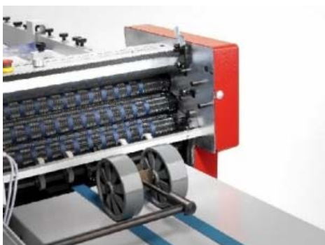
Rulli in acciaio e poliuretano